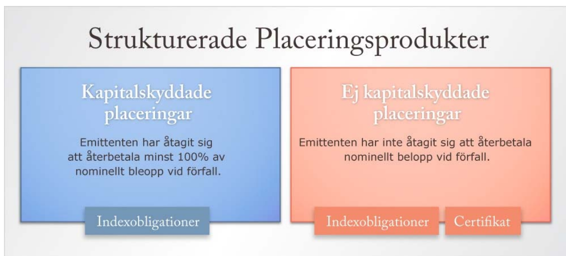
Figur 2: Indelning av Strukturerade Placeringsprodukter

Indexobligationer kan emitteras både som kapitalskyddade och ej kapitalskyddade placeringar. Strukturerade certifikat är alltid ej kapitalskyddade placeringar.